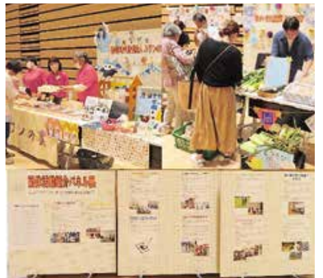
上段：出展ブース・下段：パネル展の様子

別海町在宅介護者と歩む会では、介護相談を行い、介護や日頃の悩みなどの相談を受けました。