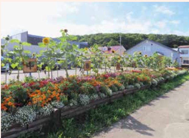
連合町内会の部最優秀賞「中春別町内会」