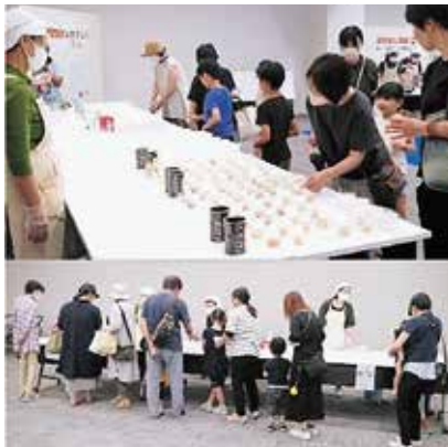
来場者の関心を引いた非常食ビュッフェ

また、軽食コーナーでは、別海町子ども会育成連絡協議会から、焼きそばが振る舞われました。