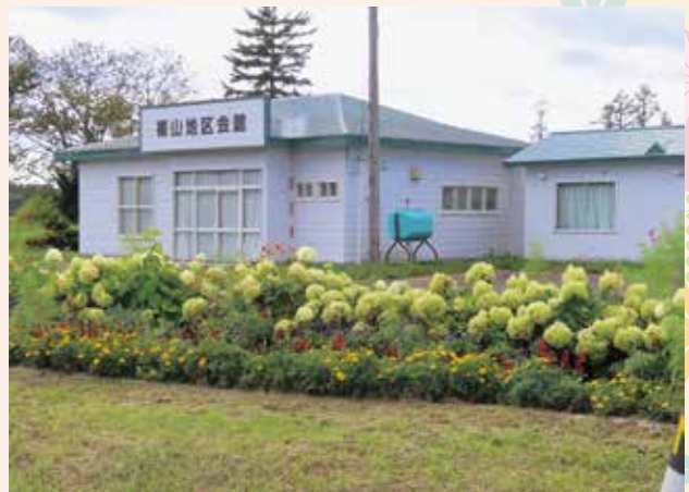
単位町内会の部最優秀賞「福山地区会」