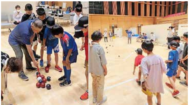
別海中央豊生クラブの皆さんとポッチャを楽しみました

別海中央豊生クラブ（老人クラブ）の協力のもと、子どもたちにポッチャ競技を体験してもらい、世代を超えて交流を深めました。